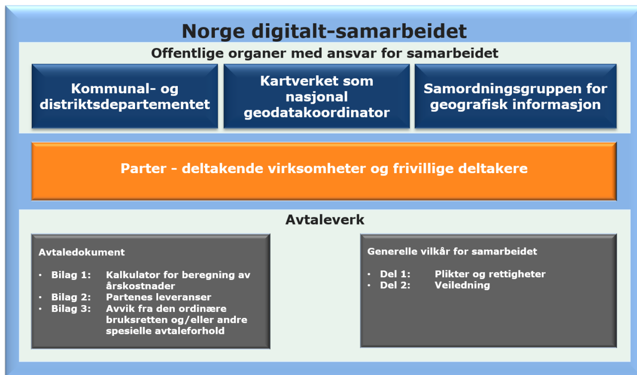
Figur 1 Norge digitalt-samarbeidet

Del I i dette dokumentet inneholder plikter og rettigheter for partene i samarbeidet, og del II er en veiledning for gjennomføringen. Sammen med avtalen om deltakelse og bilagene 1-3 til avtalen, regulerer dokumentet samarbeidet i Norge digitalt.